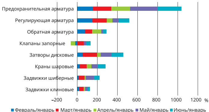
Рис. 3. Помесячная динамика производства трубопроводной арматуры в натуральных показателях к январю текущего года