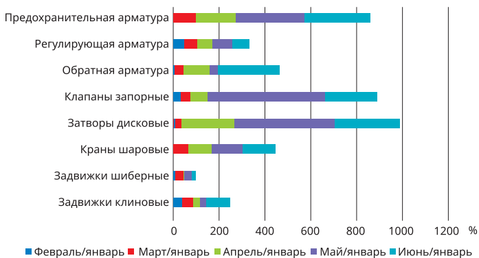
Рис. 2. Помесячная динамика производства трубопроводной арматуры в стоимостных показателях к январю текущего года