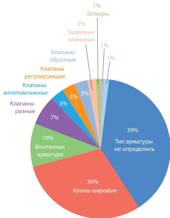
Рис. 1. Распределение закупок ПАО «Газпром» по типам арматуры (в стоимостном выражении), январь–сентябрь 2018 г.

Одной из целей изучения информации, размещенной в ЕИС, был сбор данных о стандартах в технических требованиях к по-